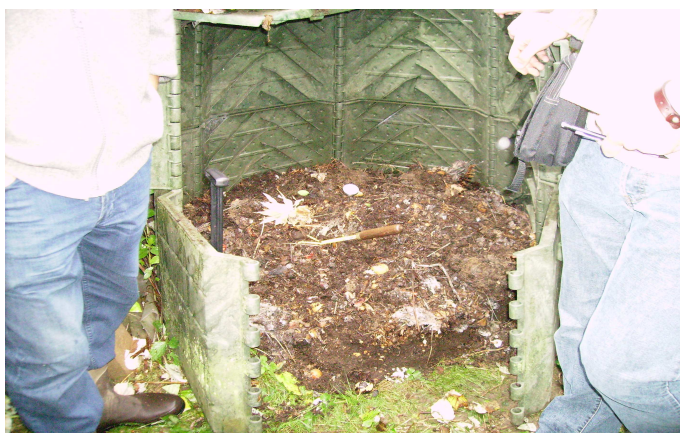
Aspect pratique de la formation réalisée pour la Communauté de Communes du Plateau Picard en 2010